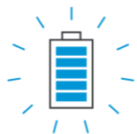
12 hours battery life