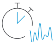
Low latency of 1.9 ms

Wie schon die EW-D-Schwestermodelle bietet auch EW-DX die niedrigste Latenz auf dem Markt (1,9 Millisekunden), macht eine Frequenzberechnung überflüssig und bietet einen ultraweiten Eingangsdynamikbereich von 134 dB, sodass Ihre Sender jedes Signal verarbeiten können, das ihnen zugeführt wird. Die Akkulaufzeit der wiederaufladbaren Batterie BA 70 beträgt zwölf Stunden, was in der Regel für Proben und Live-Events aller Art ausreicht. Mit normalen AA-Batterien kommt das Mikrofonsystem auf acht Stunden Leistung. Je nach HF-Umfeld haben die Sender eine Reichweite von bis zu 100 Metern, was auch für weitläufige Bühnensettings ausreicht.